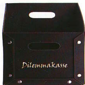
Dilemmakasse 149 kr. (Idemøbler).

Jo mere du rydder op, jo større lyst får du til at rydde endnu mere op.